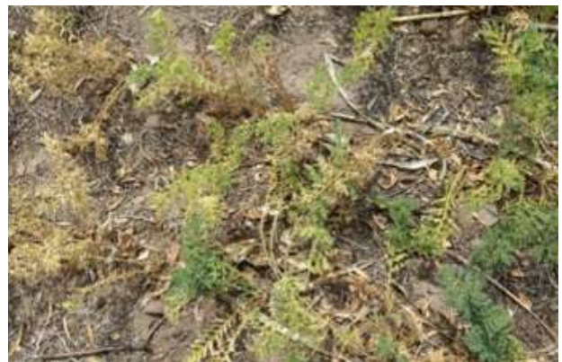
Figura 1. Aspecto que presentan las plantas de garbanzo cuando están infestadas por Melanagromyza sojae (Dip.: Agromyzidae). Los síntomas pueden ser confundidos por daños de enfermedades del suelo (Imágenes: M. Alejandro Vera).