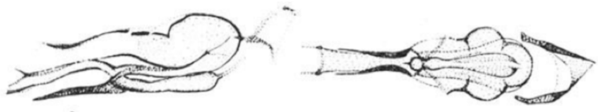
Figura 4. Morfología del edeago de Melanagromyza sojae (Dip.: Agromyzidae): A) vista lateral y B) vista ventral (Imágenes de Spencer 1973).