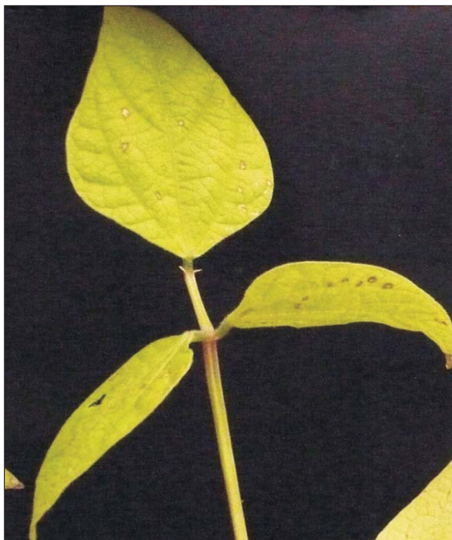
Figura 3. Reacción de la línea de poroto negro MAB 91 a la inoculación con el patotipo 63:23 de P. griseola en invernadero.