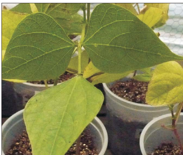
Figura 1. Reacción de la línea de poroto negro MAB 95 a la inoculación con el patotipo 63:7 de P. griseola en invernadero.

* Reacción a mancha angular, basada en una escala de 1 a 9, donde 1= plantas sin síntomas; 3= plantas con 5% a 10% del área foliar con síntomas; 5= plantas con el 20% del área foliar con síntomas y esporulación; 7= plantas con más del 60% del área foliar con síntomas y esporulación, frecuentemente asociada a clorosis y necrosis de los tejidos y 9= plantas con 90% del área foliar con síntomas, frecuentemente asociada a caída temprana de la hoja y muerte de la planta.