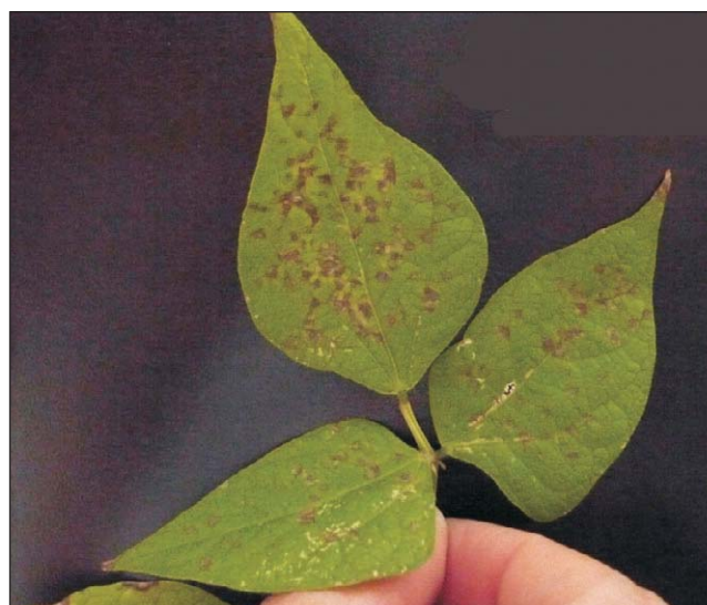
Figura 2. Reacción de la variedad de poroto negro TUC 550 a la inoculación con el patotipo 63:7 de P. griseola en invernadero.